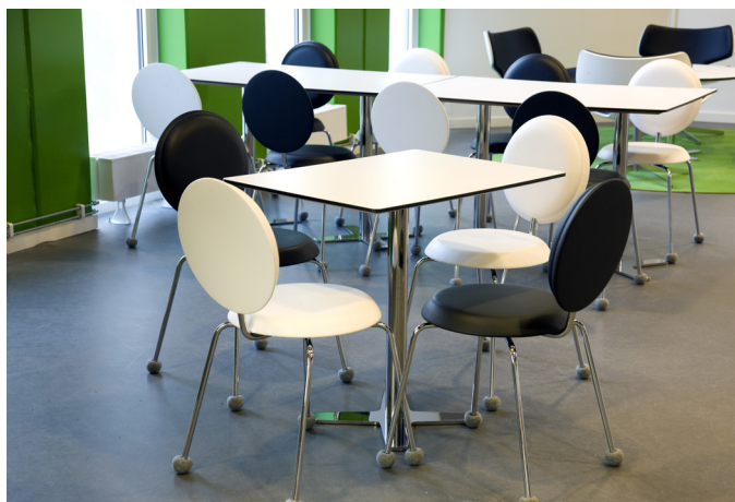
Silent Socks® på IHM Businessschool.